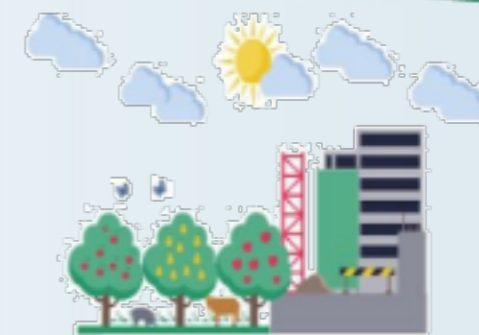
Comité Técnico de Política de Desarrollo Productivo