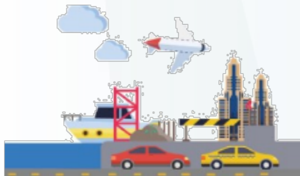
Comité Programático de Logística