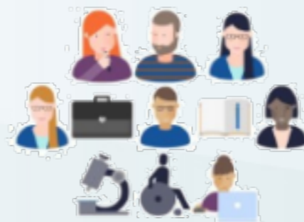
Comisión Intersectorial para la Gestión del Recurso Humano