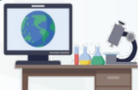
Comité Técnico de Ciencia, Tecnología e Innovación