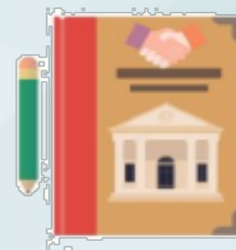
Comité de Mejora Normativa